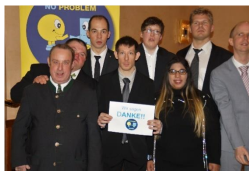
No Problem Ball 2023