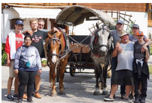
Sommerausflug nach St. Aegydt/Neuwalde

Hier noch einige Eindrücke der Highlights des abgelaufenen Jahres: