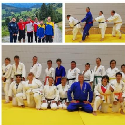
Teilnahme Trainingslager in Hintermoos